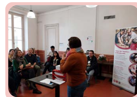
Matinal Day Entreprises 2023

Tables rondes employeurs et visite de l'établissement