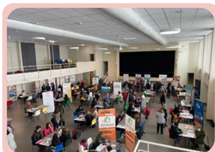
Carrefour des ateliers 2023